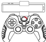
Индикатор режима "МЕДИА"

После того как Вы установите сопряжение джойстика с устройством, переведите переключатель режимов в положение «М».